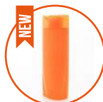
Crema de sol